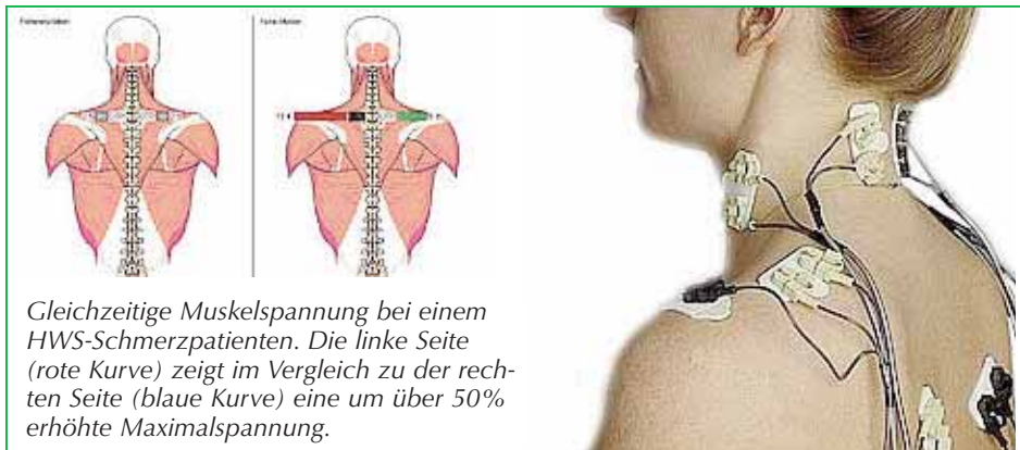
Gleichzeitige Muskelspannung bei einem HWS-Schmerzpatienten. Die linke Seite (rote Kurve) zeigt im Vergleich zu der rechten Seite (blaue Kurve) eine um über 50% erhöhte Maximalspannung.

Dann erfolgt mittels des Sinfomed-Verfahrens eine schmerzfreie Messung der Muskelspannung. Nach erfolgreicher Diagnostik ist es daraufhin möglich, Ihnen die Lösung für Ihr Problem zu geben. Dabei nutzen wir das Biofeedback-Verfahren. Das Biofeedback Verfahren ermöglicht dem Patienten, selbstständig seine Verspannungen durch das Erlernen von bestimmten Entspannungsverfahren zu verbessern und aufzuheben.