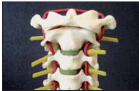
Halswirbelsäule (HWS) von vorne

Als einzige Praxis in Mülheim an der Ruhr bieten wir seit Jahren die lichtoptische 3-dimensionale Wirbelsäulenstatikvermessung unseren Patienten an. Dabei nützt dieses Verfahren nicht nur Patienten, die an Schmerzen im Bereich der Hals-, Brust- und Lendenwirbelsäule leiden, sondern auch Patienten mit Fehlhaltungen und schmerzenden Gelenken an z.B. Hüft-, Knie- und Fußgelenken. Unsere mit Naturheilverfahren und Schulmedizin gepaarte Praxisphilosophie lautet: